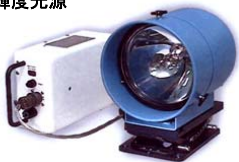
Hyge Light 4528 及び バッテリー B15-2A、マウント QD-100